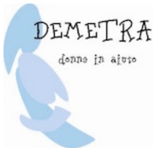
Centro antiviolenza Demetra